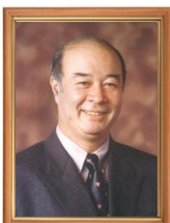
นายมีชัย วีระไวทยะ กรรมการ