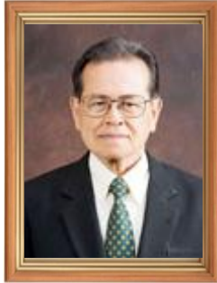
ศาสตราจารย์นายแพทย์ประเวศ วะสี ที่ปรึกษาคณะกรรมการ